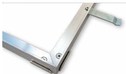
Telaio angolare con congiunzioni ad angolo e ancoraggi (fornitura senza montaggio)