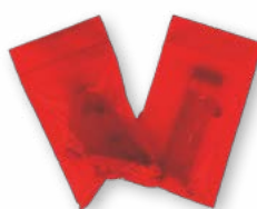
Le congiunzioni ad angolo e gli ancoraggi vengono forniti sciolti