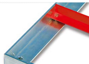
I profili angolari rossi costituiscono un aiuto per il montaggio di telai con i lati di lunghezza superiore ai 2 m